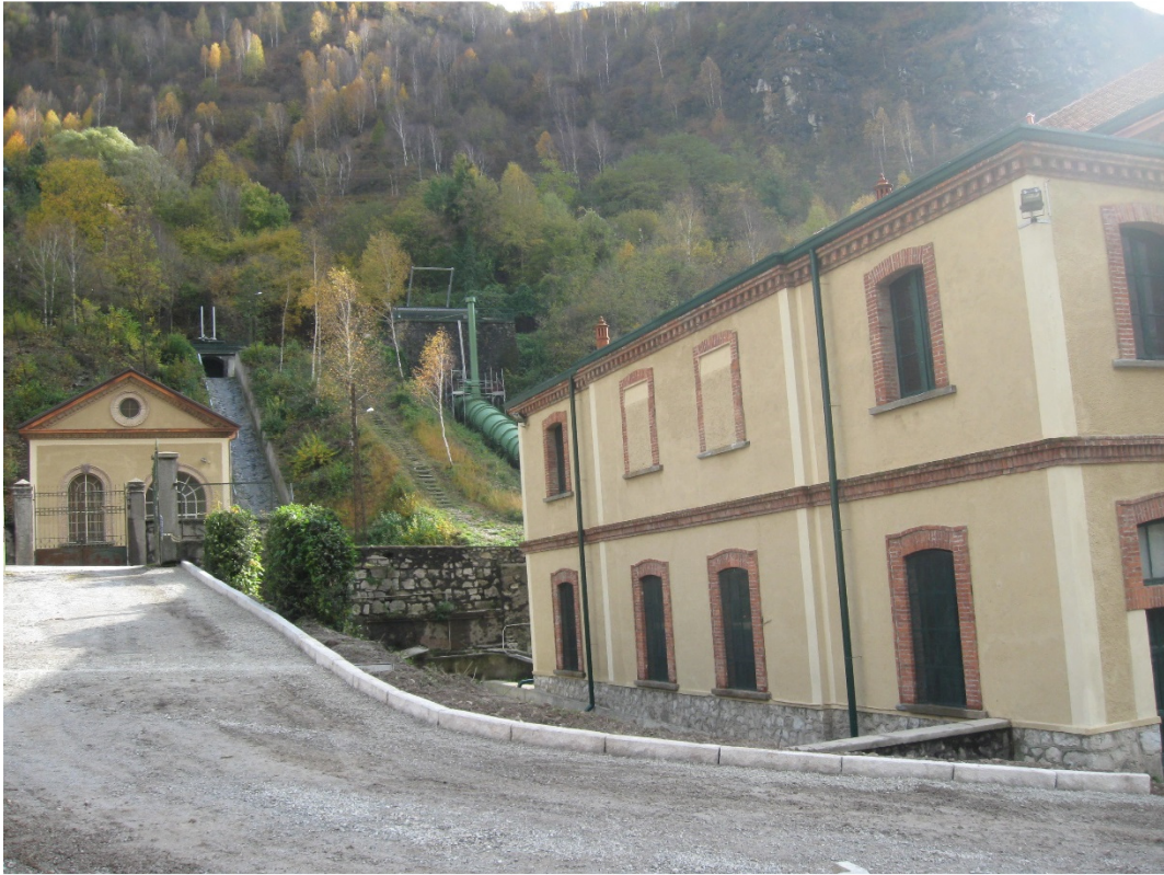
1. Esterni centrale idroelettrica Costone, Val Seriana