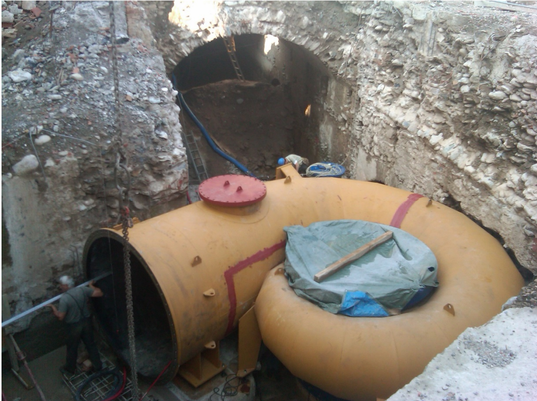
3. Esterni centrale idroelettrica Pontenossa, Val Seriana