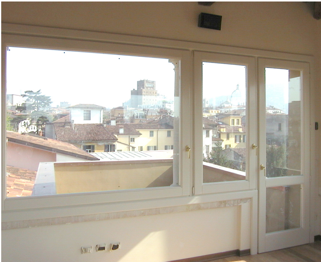
4. Palazzo Cima del Moretto, Brescia